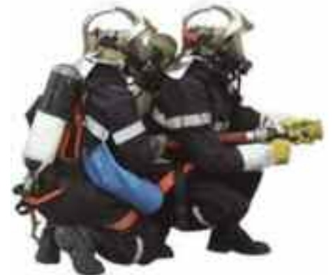
Binôme équipé d'A.R.I.

Dimanche 5 février et samedi 11 février au matin les pompiers de Saint Brice Courcelles étaient en manœuvre à la résidence Roux à Reims dans les bâtiments qui sont voués à la destruction. Vous allez découvrir des photos des manœuvres A.R.I (Appareil respiratoire isolant). L'ARI est un appareil essentiel pour la pénétration dans des locaux enfumés ou toxiques. Les ARI utilisés par le centre sont des mono bouteilles avec bouteille d'air de capacité de 9L (d'eau) avec de l'air à 300 bars. Ainsi, la bouteille contient 2 700 L d'air. Il permet d'apporter de l'air pur au sapeur-pompier l'utilisant. L'ARI est l'organe de survie du sapeur-pompier qui est engagé pour la recherche de victime en milieu enfumé ou toxique ou