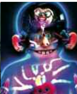
Organopolis France - 2011 - 2' de Luis Nieto