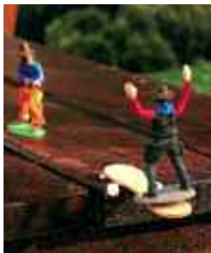
Petits joueurs saut périlleux France - 2012 - 1'30 de bruno collet

Le dimanche 27 janvier à 16h, Maison des Arts Musicaux entrée 3 € pour les enfants, gratuit pour les accompagnateurs.